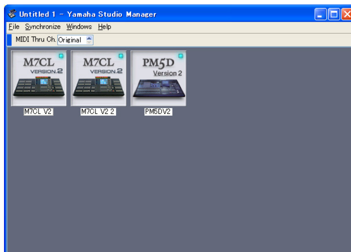
Ventana Studio Manager

En la ventana Studio Manager, haga doble clic en el icono de cada editor.