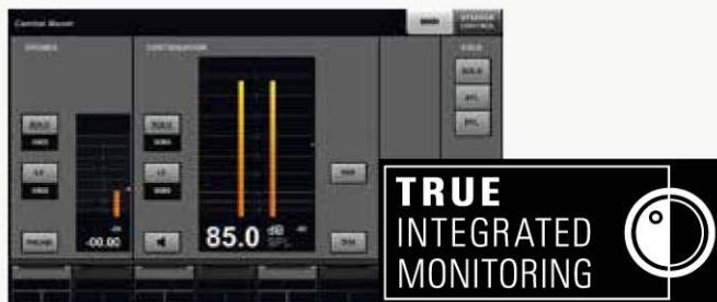
TARJETA DE ACCELERACIÓN DE DANTE PCI-E SUPERFICIES DE TRABAJO

Estaciones de audio digital, controladores e interfaces: la verdadera postproducción profesional solamente puede lograrse cuando todos los componentes funcionan en perfecta armonía. El sistema de producción de audio integrado NUAGE reúne todas las funciones y capacidades necesarias en un conjunto que define los nuevos estándares de calidad y eficacia en el flujo de trabajo para prácticamente cualquier aspecto del proceso de producción. El hardware de control y las interfaces diseñados por Yamaha se integran a la perfección con el software de audio digital (DAW) Nuendo de Steinberg en un sistema dedicado que ofrece una productividad y una flexibilidad sin precedentes, así como una calidad de audio del máximo nivel. Los ingenieros y artistas experimentados que ya conocen la calidad sonora y el flujo de trabajo intuitivo de la estación de procesamiento de audio digital de Nuendo de Steinberg se complacerán al saber que Nuendo 6, que se incluye con Nuage, todavía significa subir un escalón más. Y para una mayor versatilidad del sistema, la superficie de control dedicada y el hardware de la interfaz de audio de Yamaha presentan son modulares, por lo que es muy fácil crear una configuración personalizada de acuerdo a los requerimientos y aplicaciones en cada caso. Nuage es ideal para mezclar, editar o sustituir diálogos en postproducciones de audio. Por fin se combinan un hardware y un software de primera clase en perfecta armonía.