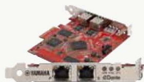
TARJETA DE ACCELERACIÓN DE DANTE PCI-E