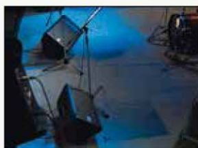
CAJAS SIMÉTRICAS PARA MONITORES DE SUELO EN ESPEJO (DXR12/DXR15)