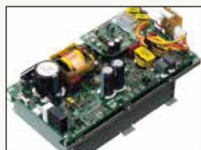
AMPLIFICADORES CLASE D MUY EFICIENTES DE 1100 W