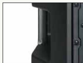
CAJAS DE ABS DURADERAS Y COMPACTAS