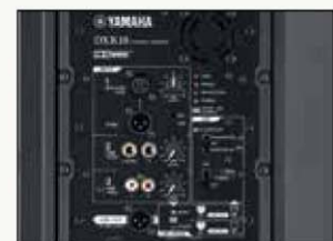
PARTE POSTERIOR (DXR15/DXR12/DXR10/DXR8)